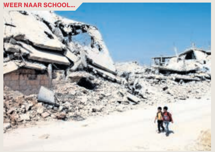
■ Syrische schoolkinderen lopen langs de door oorlog verwoeste gebouwen in het zuiden van de stad Daraa. Het gebied wordt nog gecontroleerd door rebellerende groepen.